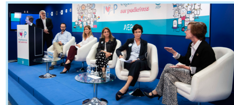
Debate "La humanización de la atención médica en Pediatría".

Enlace al vídeo completo del acto: https://www.aeped.es/video-acto-dia-p-2018