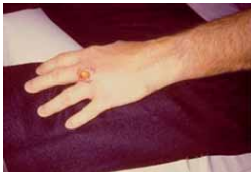
Lesión por picadura de araña marrón.

Tratamiento 30 : en general basta (en nuestra zona) con limpieza y desinfección de la zona, realizando curas periódicas, y analgésicos orales. Puede ser útil el extractor de veneno de Sawyer. Se han utilizado diversos fármacos a título experimental (dapsona, colchicina, nitroglicerina tópica) para tratar el cuadro cutáneo