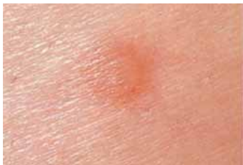
Pápula por picadura de mosquito.

El tipo de lesiones, salvo que las picaduras están agrupadas y son producidas por un mismo insecto, es semejante al de los dípteros, como también el tratamiento.