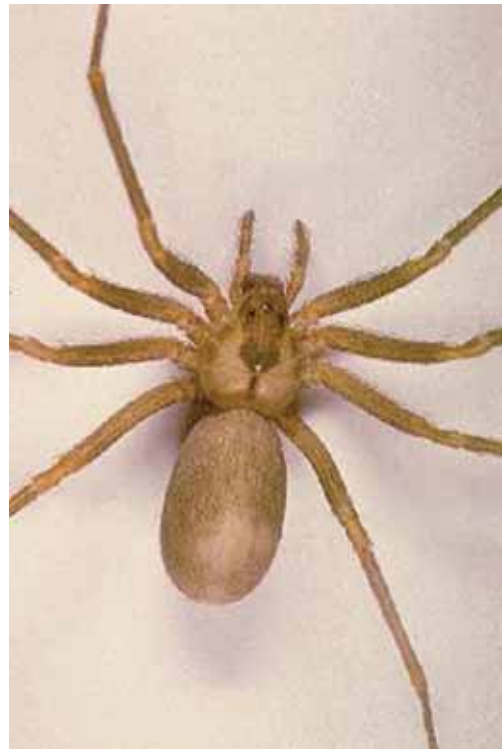
Arañas marrones de los rincones.