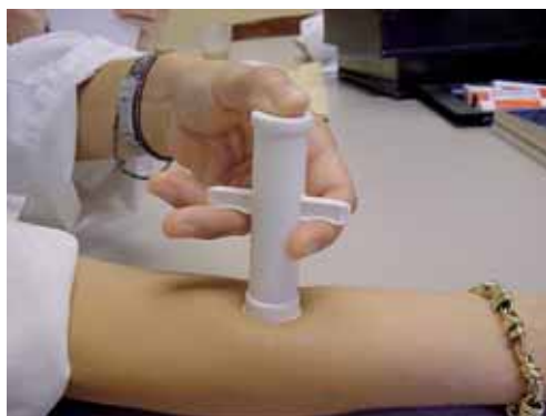
Extractor de Sawyer.

Tratamiento: lavado de la zona y frío local. Puede ser útil el extractor de veneno de Sawyer. En caso de aparecer manifestaciones sistémicas: analgésicos, corticoides y antihistamínicos sistémicos (dudosa eficacia), además de rela-