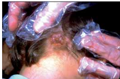
Úlcera necrótica por picadura de garrapata.