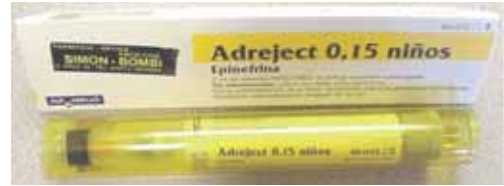
Kit de adrenalina autoinyectable comercializado en España.

abdomen, provocando la muerte del insecto. El veneno es rico en enzimas (fosfolipasa A2, hialuronidasa) y sustancias de bajo peso molecular que varían entre las distintas especies. Inyectan de 50 a 100 mcg de veneno.