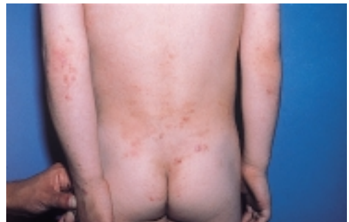
Figura 1. Dermatitis herpetiforme. Clínica: Pápulas y excoriaciones localizadas en zonas de extensión.

La dermatitis herpetiforme no suele aparecer antes de los 2 años de edad. Se piensa que esto es debido a que el gluten no se introduce en la dieta antes de esa edad. La erupción cursa con un prurito muy intenso y se localiza preferentemente en las zonas de extensión (Figura 1): codos, cara posterior de los antebrazos, rodillas, glúteos, nuca, aunque hasta en un 10% puede haber una distribución atípica y puede afectarse cualquier parte de la piel. Aun-