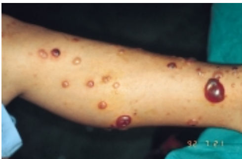
Figura 3. Enfermedad ampollosa por IgA lineal de la infancia. Clínica: Vesículas y ampollas sobre una base urticariforme.

Clínica e histológicamente puede ser parecida a la dermatitis herpetiforme, y hasta hace pocos años muchos casos se diagnosticaban de "dermatitis herpetiforme con depósitos lineales de IgA". En la actualidad se considera que la llamada "enfermedad ampollosa crónica de la infancia" corresponde a la forma infantil de esta enfermedad. El cuadro clínico es bastante característico. Suele tratarse de niños en edad preescolar en los que aparece de forma más o menos repentina un brote de lesiones cutáneas vesiculosas y ampollosas tensas que son pruriginosas (Figura 3). Puede existir un cuadro sistémico acompañante con malestar, fiebre y anorexia. Las lesiones pueden aparecer sobre piel sana o bien sobre piel placas urticariformes. La distribución policíclica o anular de las lesiones es muy típica de esta enfermedad. Las ampollas se distribuyen en periferia formando unas lesiones que se han comparado con un collar de perlas. Suelen aparecer