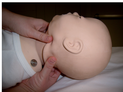
Figura 2. Inmovilización cervical lateral