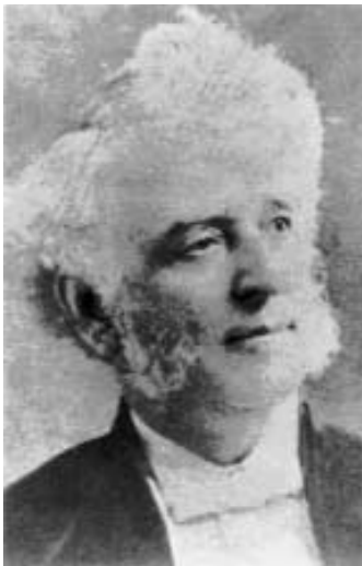
Figura 1. John Langdon H. Down.