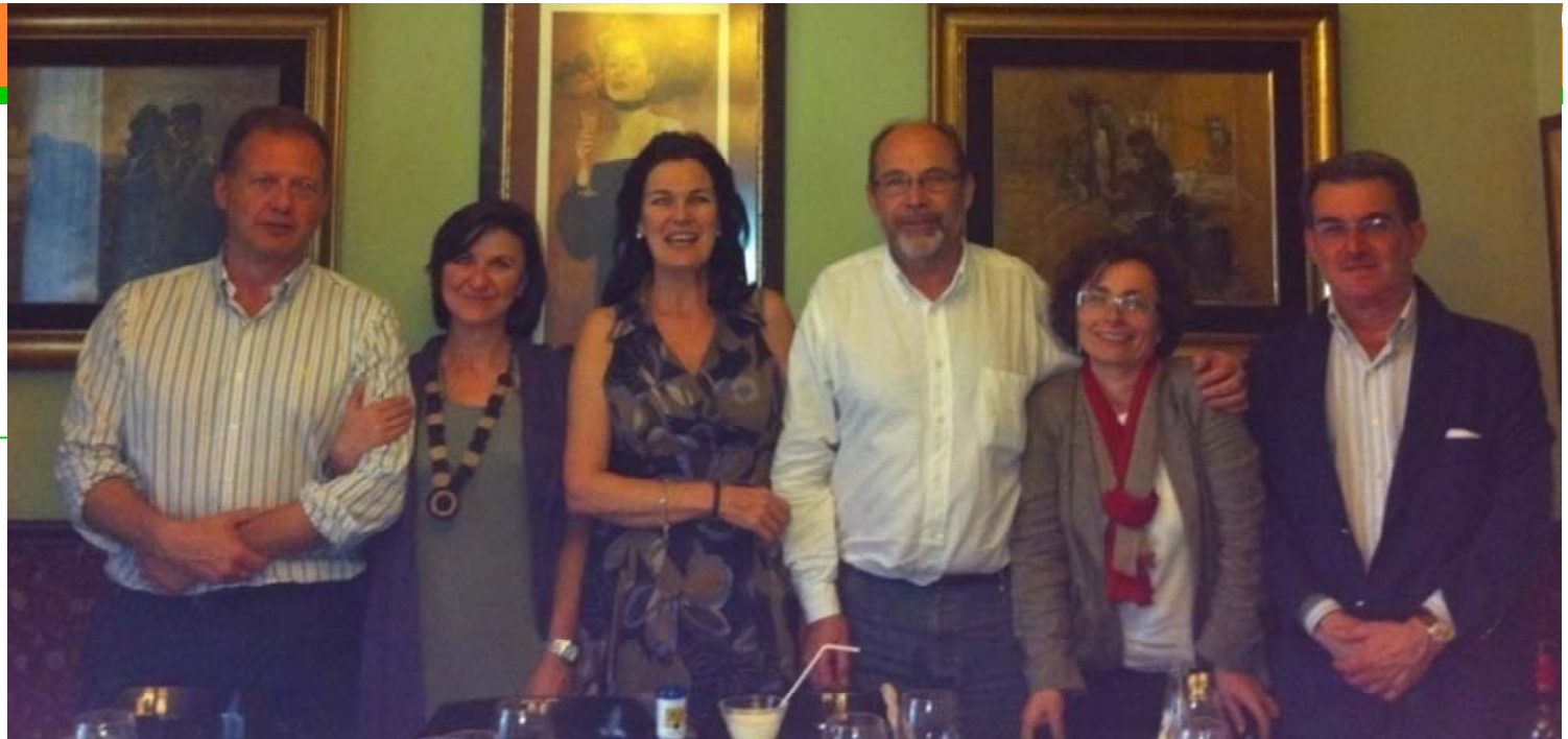
Primera Reunión Grupo Cooperación Internacional AEP, Madrid, 26 de mayo 2011