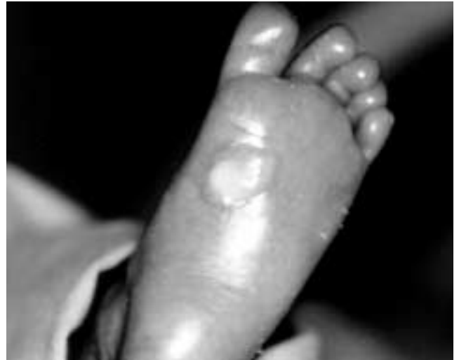
Figura 1. Lesión ampollosa de 0,5cm en la planta del pie.

la casa suministradora realizó un estudio ciego, junto con otros cuatro sensores aparentemente sin problemas. Las mediciones se realizaron dentro de una incubadora a 33°C, mediante una sonda de temperatura Modelo Stow Away Data Loggers Miniatura Avanzados. Se programó el sensor para adquirir datos de forma continua, almacenando el valor promedio de todos ellos en periodos de 10 minutos. Las mediciones se tomaron a lo largo de 72 horas, cambiando de sensor cada 6 horas. Ningún registro demostró malfunción. Dado que el monitor y el cable han seguido utilizándose sin problemas en otros niños, no pensamos que el fallo radicase en ellos.